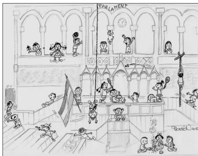
Lehet a parlamentben is táborozni, főleg uborkaszegzonban...